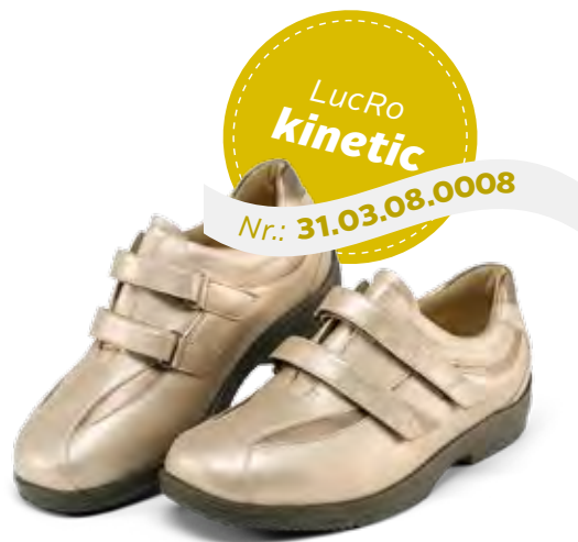
Der schlankere Typ